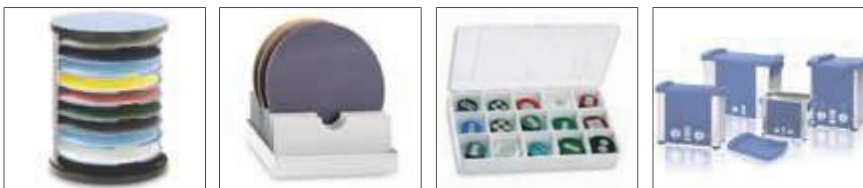
Tour de rangement pour vos consommables